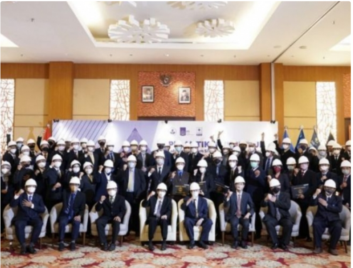
Ke-93 insinyur baru dari ITS bersama jajaran pimpinan ITS dan Persatuan Insinyur Indonesia Wilayah Jawa Timur

SURABAYA – Hingga saat ini, insinyur yang diakui secara formal di Indonesia baru mencapai sekitar 10.900 orang, padahal jumlah lulusan sarjana teknik dan serumpunnya melebihi 1 juta orang. Berkontribusi untuk mengatasi profesi insinyur tersebut, Institut Teknologi Sepuluh Nopember (ITS) melalui Program Studi Profesi Insinyur (PSPPI) melantik 93 insinyur baru, Sabtu (16/4/2022).