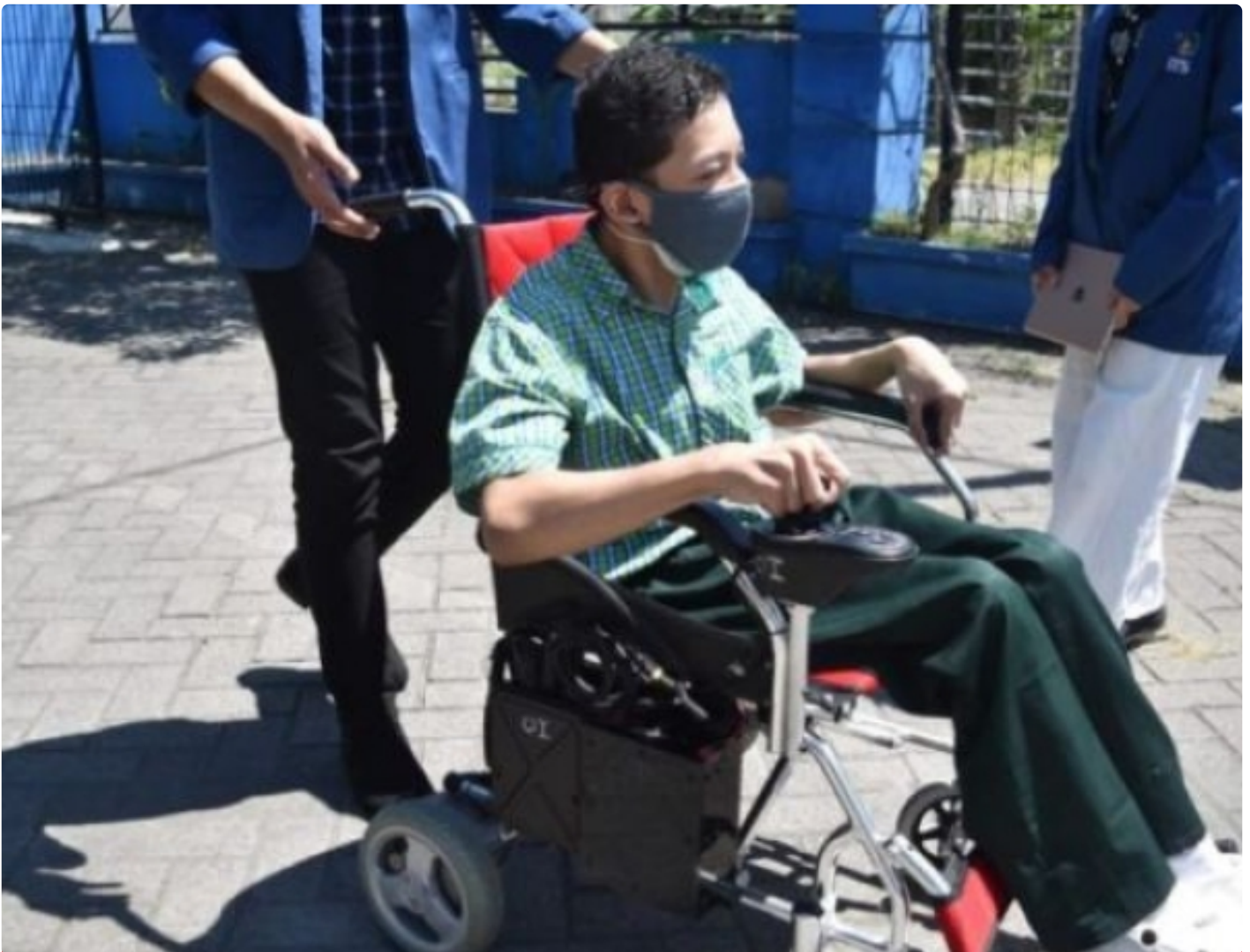
Kursi roda elektrik untuk disabilitas karya mahasiswa Departemen Teknik Biomedik ITS

SURABAYA – Peminatan Teknologi Asistif dan Rehabilitasi Medika merupakan satu dari empat bidang peminatan unggulan di Departemen Teknik Biomedik Institut Teknologi Sepuluh Nopember (ITS). Bidang ilmu ini berfokus pada teknologi medis yang mampu mendukung aktivitas para penyandang disabilitas